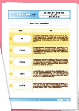
栄養解析レポート