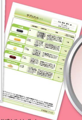
サプリメントレポート

健康診断と同じ血液検査項目でも、オーソモレキュラー栄養医学に基づいて見ると、 あなたの不調の原因が見えてきます。